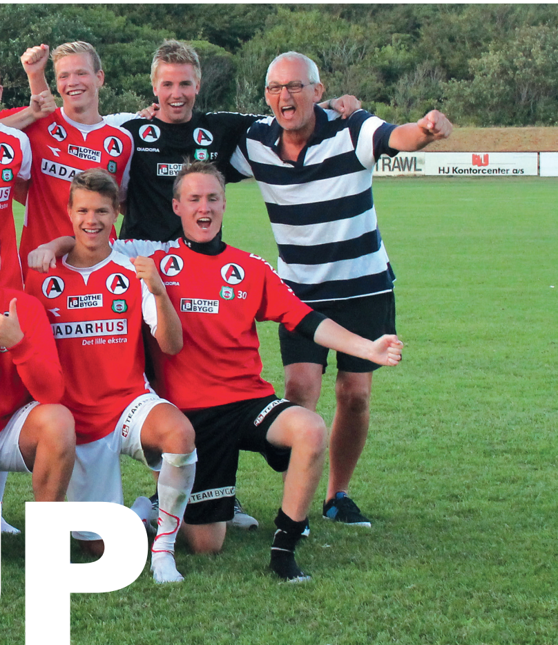
Junior Elite gjorde en god turnering, men i finalen ble det stang ut på straffesparkkonkurranse mot Elfsborg. På bildet ser vi glade juniorspillere etter semifinaleseieren mot Thisted.