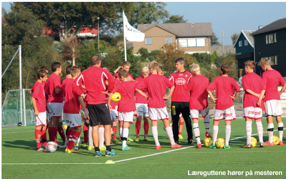
Læreguttene hører på mesteren

Per dags dato opereres det med lag på tre ulike alderstrinn, bestående av henholdsvis 98-, 99-, og 2000-modeller.