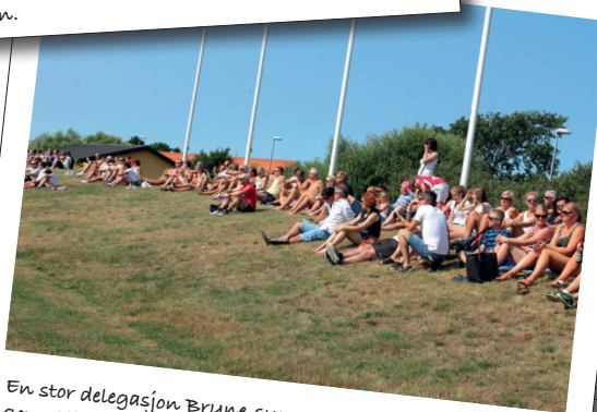
En stor delegasjon Bryne-supportere var på plass i Skawgen. Alle Bryne-lagene fikk gjennom hele turneringen veldig god støtte fra sidelinjen.